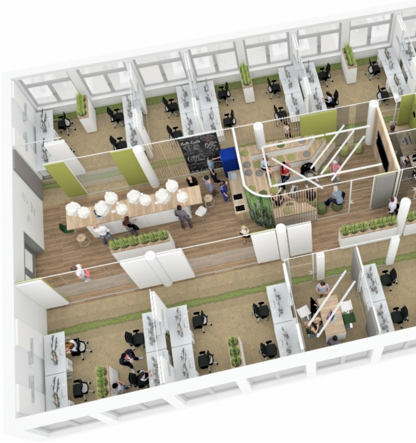
Raumplanung - HeartBeat Office Concept. Ruhe im Open Space.